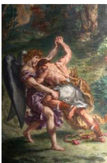
Lutte de Jacob avec l'Ange (extrait) (Paris, Eglise de Saint-Sulpice) Eugène Delacroix

Il est bon de se le remémorer, il nous a tant accompagnés durant toutes les années fondatrices, puis dans nos cheminements, nos luttes.