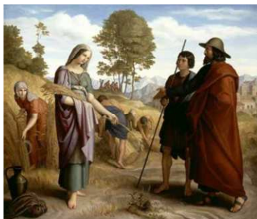
Ruth dans le champ de Booz Julius Schnorr von Carolsfeld

la grâce prévenante, la grâce prévoyante, la grâce suffisante