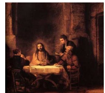
Les pèlerins d'Emmaüs (Louvre Paris) Rembrandt