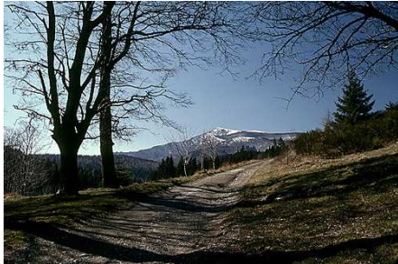
Mont Aigoual depuis l'Aire de Côte

Depuis Cognac sur la draille de transhumance jusqu'à Barre des Cévennes en 3 jours via le Mas Corbière en dessous du col d'Asclier et l'Aire de cote au pied de l'Aigoual