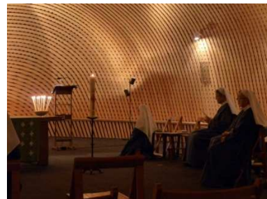
Dans la chapelle des sœurs à Versailles