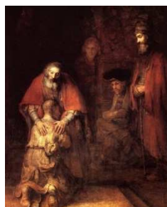
Le retour de l'enfant prodigue (Ermitage St Petersburg) Rembrandt

Une reproduction de tableau était accrochée dans la salle haute du Gourguet ; c'est une histoire de cheminement de solitude et d'un retour, aussi d'accueil et d'amour !