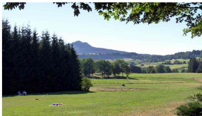
Le Lisièux vu depuis la Costette

Considère-le dans toutes tes voies, et il dirigera tes sentiers.