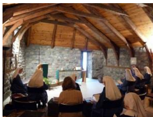
Office de midi chez les sœurs du Mazet