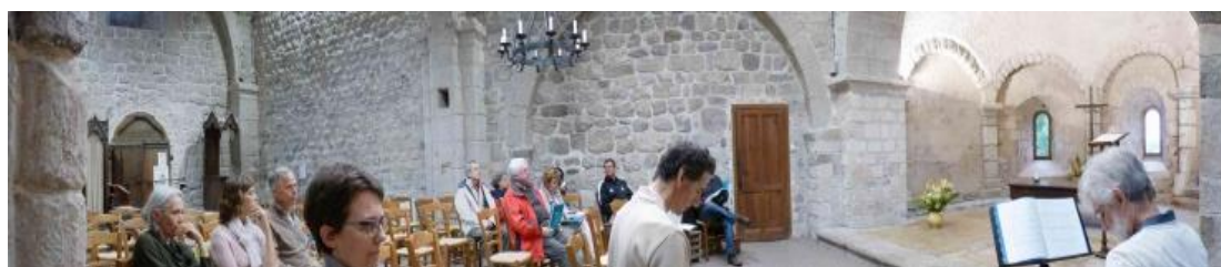
Silence avant l'office dans la chapelle du Mazet-St-Voy

La communion est animée par deux anciens, élus tous les trois ans. Les autres responsabilités (finances, animation des enfants, liturgie, accueil...) sont partagées entre tous ses membres.