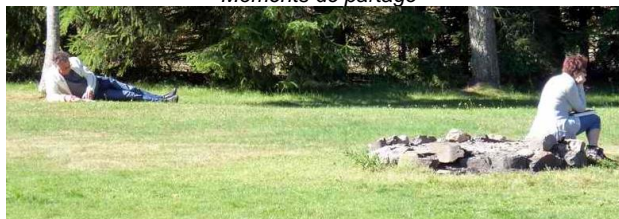
Le bonheur est dans le pré