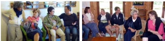
Penouel se pose à la Costette

Les offices du matin et du soir où nous redoutions de ne plus avoir la chapelle de Gourguet se vivaient dans l'église de St-Voy - donc dans un cadre de prière exceptionnel