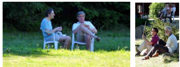
Moments de partage

Questions : dans la prière, comment remettre à Dieu une situation dont on ne voit pas l'issue ? Question sur fidélité et loyauté : fidélité simple (je ne te quitterai pas, je ne te tromperai pas), fidélité positive (je ferai des efforts pour toi, je me garderai belle pour toi). Qu'est-ce que la fidélité positive ? Que signifie la fidélité, la loyauté envers Dieu ?